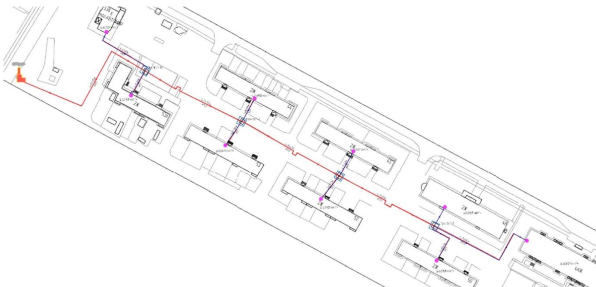
Рисунок 1. Исходная расчетная схема сети теплоснабжения.

Проведенный расчёт (с которым можно ознакомиться в приложении к данной статье ) показал, что все варианты полностью соответствует требованиям, предъявляемым к трубопроводам тепловых сетей по показателю нормативного уровня тепловых потерь. Также видно, что подобранные в конструкторском расчете диаметры эффективнее существующих (которые завышены) с точки зрения затрат и тепловых потерь через изоляцию, средней скорости движения теплоносителя и как следствие, температуры на вводе в тепловой пункт. При этом использование трубопроводов ИЗОПРОФЛЕКС-115А позволяет улучшить гидравлические режимы эксплуатации тепловой сети (за счет малой шероховатости и гибкой схемы прокладки) и при использовании схожих по сортаменту диаметров значительно уменьшить потери напора на сетях, что позволяет снизить требуемый располагаемый напор и как следствие уменьшить затраты на электрическую энергию при работе насосного оборудования. Имеется возможность привести располагаемые напоры в точке подключения к одинаковому значению тем самым уменьшить диаметры труб ИЗОПРОФЛЕКС и выровнять затраты на транспортировку воды, но в данном сравнении делается упор на снижение непрерывных эксплуатационных затрат, которые снижают стоимость последующей эксплуатации инженерных систем и дает дополнительный резерв пропускной способности для обеспечения возможности подключения перспективных потребителей.