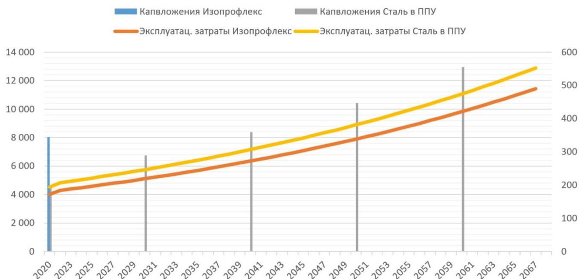
Рисунок 3. Финансовая модель жизненного цикла проекта (для капвложений левая ось, для эксплуатационных затрат – правая ось, в тыс. руб.).

На рисунке 4 показана структура накопленных за период жизненного цикла проекта затрат по вариантам. Наибольшая экономия в размере 36,6 млн.руб. достигается при использовании пластиковых труб.